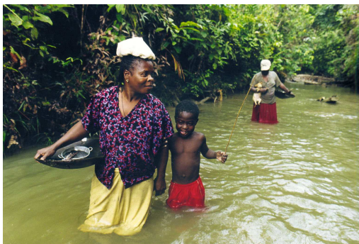
Projekt „Oro verde“ in Kolumbien

Schauen sie doch mal vorbei – wir freuen uns über Ihr Interesse.