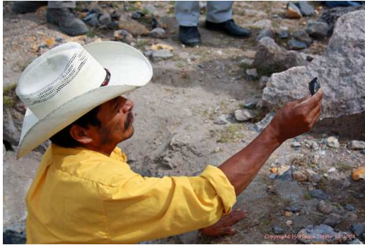
Projekt Opalabbau Honduras