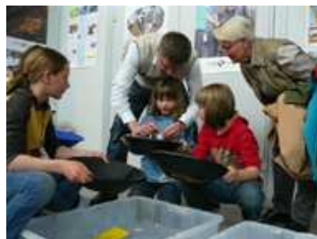
Aktion Goldwaschen Messe Stuttgart